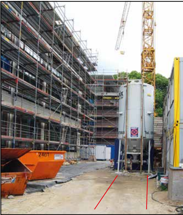
Zugang freihalten für unsere Silowagen