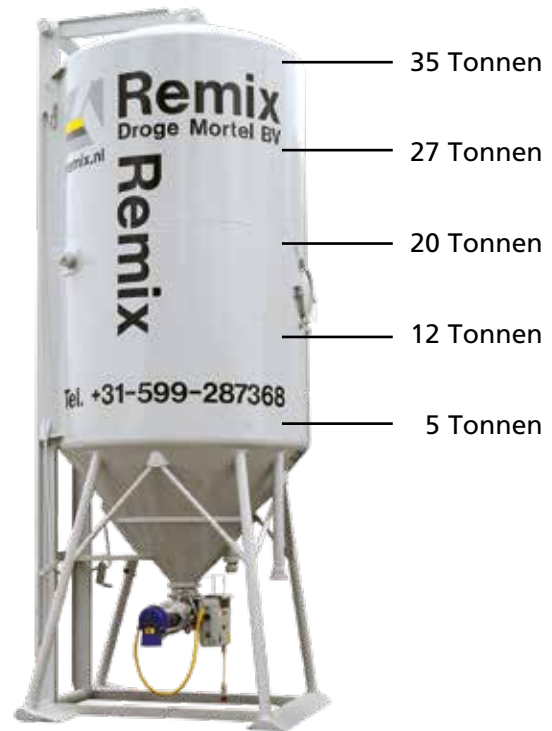
Tonnenangabe auf Basis von 1800 kg/cbm