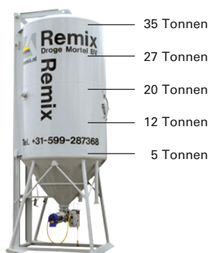
Tonnenangabe auf Basis von 1800 Kg/cbm

Wenn ein Silo auf einer nicht besetzten Baustelle abgestellt werden soll, muss der Standplatz deutlich gekennzeichnet sein und/oder eine Skizze mit Angaben des gewünschten Stellplatzes, der kompletten Bauadresse und der Telefonnummer der verantwortlichen Person, die während der Zeit des Aufstellens auch telefonisch erreichbar sein muss per E-mail an Abteilung Planung (dispo@remix.nl) geschickt werden.