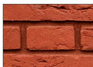
Mit ausblühungsarme Fugenmörtel