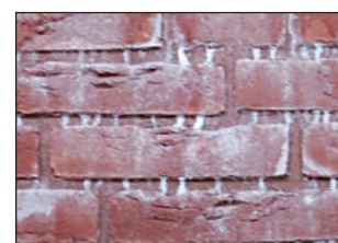
Ohne ausblühungsarme Fugenmörtel