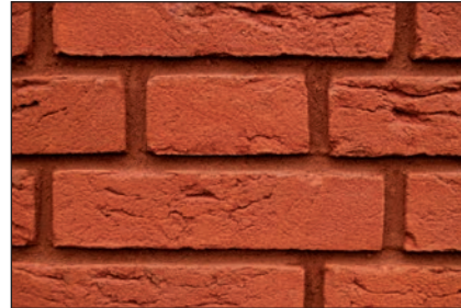
Mit ausblühungsarmem Fugenmörtel