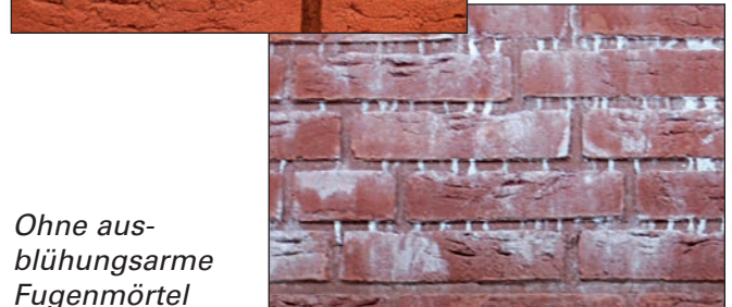
Ohne ausblühungsarmen Fugenmörtel

Auslaugungen/Ausspülungen kann es zu weißen Ablagerungen von Inhaltsstoffen aus dem Stein, dem Mauermörtel und/oder dem Fugenmörtel kommen. Bei der Aushärtung von frischem Mauerwerk (mit oder ohne Glattstrich) entstehen die weißen Ausblühungen, weil die im Mörtelwasser gelösten Stoffe (Calciumhydroxid) durch die Feuchtigkeitsströmung an die Oberfläche des Mauerwerks gelangen können.