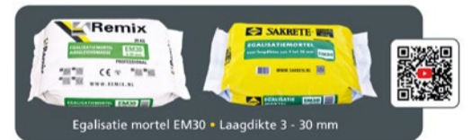
Egalisatie mortel EM30 • Laagdikte 3 - 30 mm