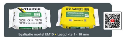
Egalisatie mortel EM10 • Laagdikte 1 - 10 mm