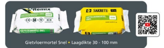
Gietvloermortel Snel • Laagdikte 30 - 100 mm