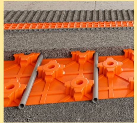
Opbouw Schlüter BEKOTEC-Therm vloer. De te storten Remix Gietvloermortel Snel komt slechts 8-25 mm boven de noppen en verwarmingsbuizen.

Een superdunne vloer kan bijvoorbeeld worden gemaakt met Gietvloermortel Snel i.c.m. het Schlüter-BEKOTEC-THERM systeem (dus met vloerverwarming). De te gieten cementdekvloer komt slechts 8 - 25 mm boven de noppen en verwarmingsbuizen. Hierdoor wordt in vergelijking met een traditionele dekvloer tot 40% bouwhoogte uitgespaard. Dit maakt het systeem ook voor renovaties een ideale oplossing. Zodra de dekvloer beloopbaar is, wordt er een ontkoppelingsmat op gelijmd. Daarop kunnen dan rechtstreeks keramische tegels of natuursteen worden gelegd. Zelfs grootformaat tegels zijn geen probleem. Belangrijke eigenschap is dat deze vloer spanningsvrij is, waardoor er geen scheuren in de dekvloer ontstaan. Hierdoor kunnen grote vloeroppervlakken worden gestort zonder dilatatievoegen. De tijdwinst is groot met dit systeem. Bij een conventionele dekvloer gaat men uit van ongeveer 70 m 2 per dag. Met Schlüter®-BEKOTEC kan tot 100 m 2 per dag worden geplaatst. Onder normale omstandigheden is het mogelijk om een Bekotec-Therm vloer al na een week op te stoken zonder opwarmingsprotocol. Dit geeft een tijdwinst van 4-6 weken!