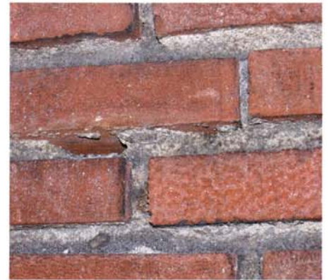
DOORSTRIJKWERK UIT BEGIN 1930. BIJ HET REINIGEN VAN DE GEVEL ZIJN TOCH STUKJES VOEGWERK VERDWENEN