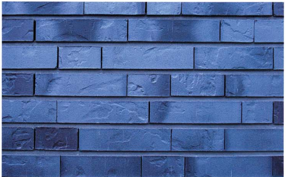
STOOTVOEGLOOS METSELWERK VAN BLAUWE STRENGPERS STENEN. DE LINTVOEGEN OP KLEUR ZIJN DOORGESTREKEN