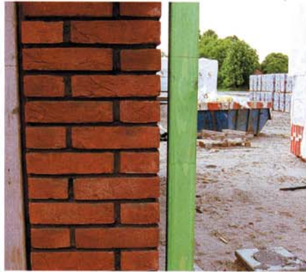
DOOR DE PROFIELEN VRIJ TE HOUDEN VAN HET WERK, KAN MEN OOK DAARACHTER GOED DOORSTRIJKEN

De geldwinst wordt enigszins teniet gedaan doordat de speciale doorstrijkmortel duurder is. Zeker als die ook nog op kleur moet zijn. Daar komt bij dat je de mortel moet aanpassen aan de steen. Doorstrijken kan in principe met strengpersstenen (hard en dicht) en met vormbakstenen (zachter en opener), maar beide typen vragen om een aangepaste mortel in verband met de vochttopname en hechting. Verder kost arbeidstijd geld, dus de prijs per vierkante meter voor het doorstrijken van metselwerk zal hoger liggen. Zaak dus om vooraf goed af te wegen naar welke kant de weegschaal uitslaat: besparing of meerprijs. Een ander bezwaar is dat niet